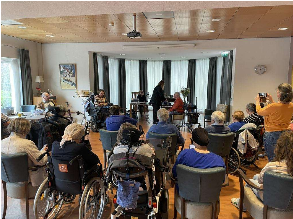
Workshop Magic Flute Norschoten

‘Een muziekinstrument bespelen heeft gunstige effecten op het brein. Veel kinderen en volwassenen met ernstige fysieke of meervoudige beperkingen kunnen geen standaard muziekinstrument bespelen en muzieklessen volgen. Dankzij de Magic Flute is dit nu wel mogelijk en kunnen zij dezelfde positieve effecten ervaren als ieder ander’ (Stichting My Breath My Music).