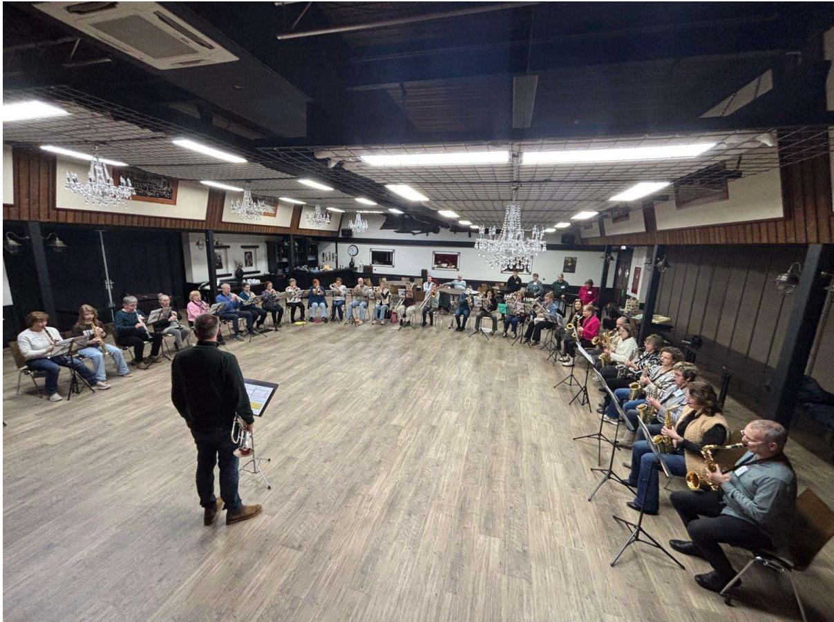
Repetitie Nieuw Talent Orkest Zwartebroek